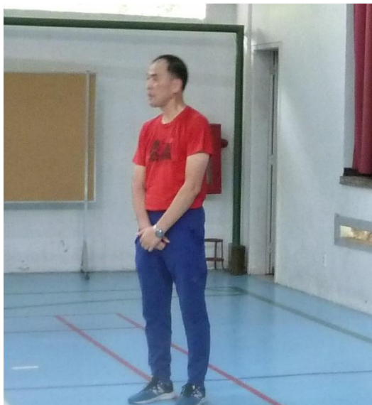
本親睦スポーツ大会を終えて総評される 日本人学校小堺校長先生