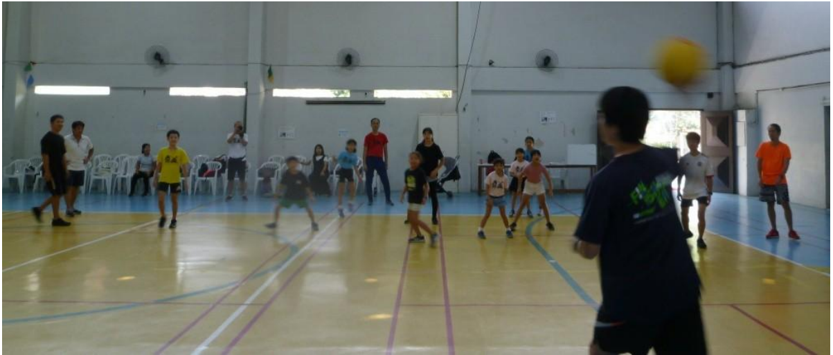
ドッジボール（混合）