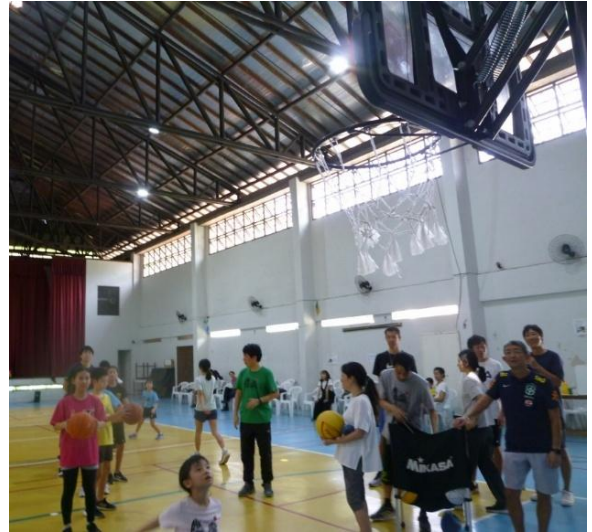
ちびっこフリースロー