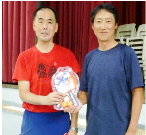
星野企画委員長より小堺校長先生へ 卓球ラケットセットの贈呈