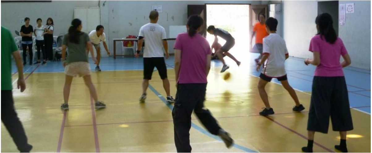
ドッジボール（大人）