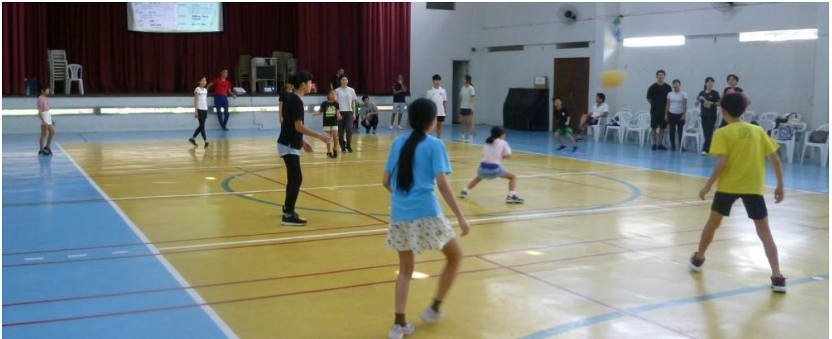
ドッジボール（子供）