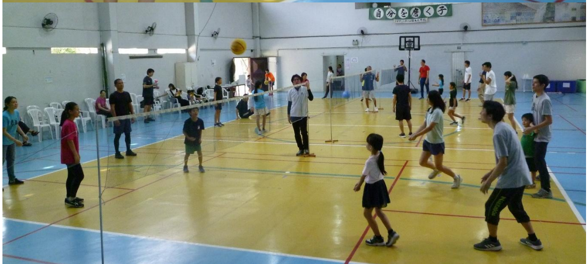
ミニバレーボール