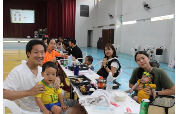
和食お弁当で舌鼓をうつご家族