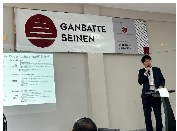
根本書記官から四世受入れ制度や 国費留学生制度について説明