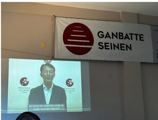
林大使からのビデオメッセージ

また、当館・根本書記官より、若手日系人等の訪日機会として、四世受入れ制度や国費留学生制度について説明を行った。その後の質疑応答では、国費留学制度を活用して訪日したい若手日系人からの同制度に関する質問がある等、闊達な意見交換が行われた。