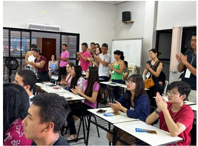
参加したゴイアス日伯文化協会青年会会員