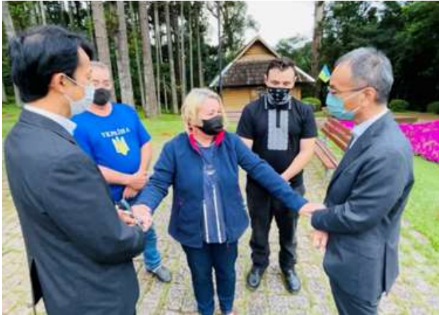
ウクライナ・コミュニティ代表者との懇談