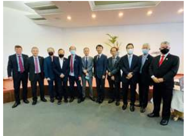
パラナ日伯商工会議所視察

16日、ラチーニョ・パラナ州知事を表敬訪問し、日系社会、環境政策、日パラナ経済関係等に関して意見交換を行った。また、ジャムール IPPUC 総裁を表敬訪問し、15年におわたる JICA を通じた同研究所への協力、今般開始技術協力プロジェクト「持続可能な都市開発能力強化プロジェクト（2022～2024）」等に関し、意見交換を実施。続いて、グレッカ・クリチバ市長を表敬し、日系社会、同市における環境政策等に関し意見交換を行った後、同市長主催の歓迎式典に参加した。