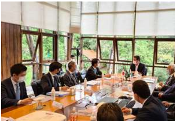
ラチーニョ・パラナ州知事表敬

16日、ラチーニョ・パラナ州知事を表敬訪問し、日系社会、環境政策、日パラナ経済関係等に関して意見交換を行った。また、ジャムール IPPUC 総裁を表敬訪問し、15年におわたる JICA を通じた同研究所への協力、今般開始技術協力プロジェクト「持続可能な都市開発能力強化プロジェクト（2022～2024）」等に関し、意見交換を実施。続いて、グレッカ・クリチバ市長を表敬し、日系社会、同市における環境政策等に関し意見交換を行った後、同市長主催の歓迎式典に参加した。