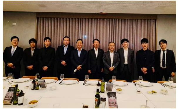
クリチバ若手日系人との懇談

17日、ブラジル住友ゴム社を訪問し、蒲原社長より活動の報告を受け、意見交換を行った後、同社の工場及び拡張中の建設サイトを視察。続いて、パラナ州に進出している日本企業関係者と共に、懇談を行った。最後に、ガゼッタ・ド・ポーヴォ紙のインタビューに対応し、ロシア・ウクライナ戦争に対する日本の立場、伯における大統領選挙、日本とブラジルの経済協力に関する質問等に答えた。