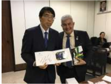
山田大使とポンテス科学技術革新通信大臣