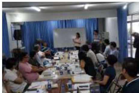
西部アマゾン日伯協会での交流 2