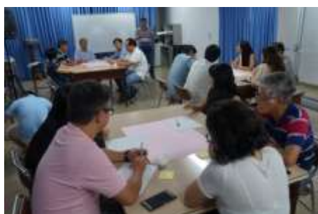
日系人のアイデンティティ に関するワークショップ