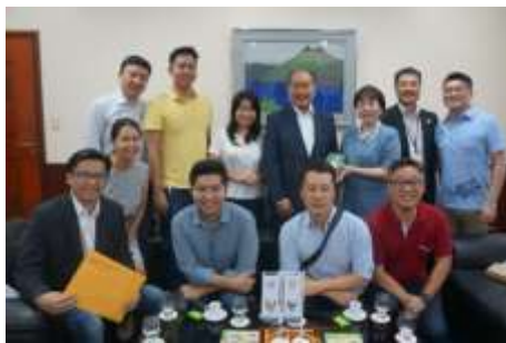
マナウス日本国総領事館にて