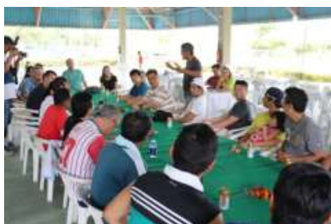
マナウス・カントリークラブ 1

24日(日)は、マナウス・カントリークラブを訪問し野球の指導等活動の説明を受け、交友を深めました。