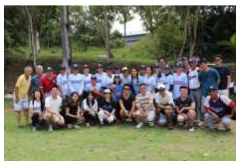
マナウス・カントリークラブ 2