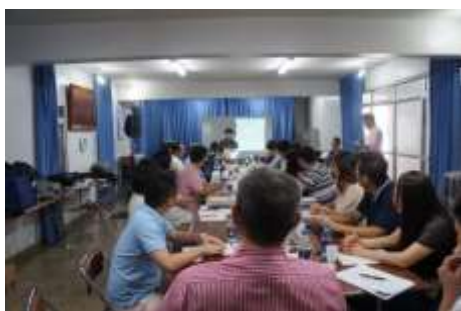
西部アマゾン日伯協会での交流 1