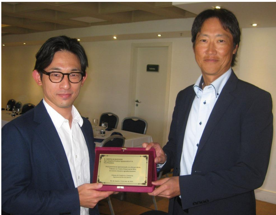
星野副会頭より記念プレート贈呈