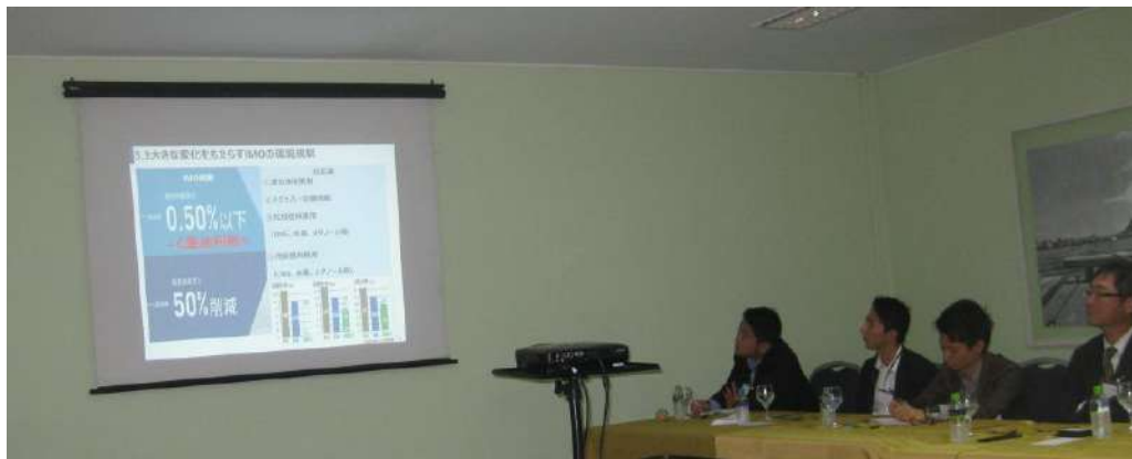
講演に興味深く聴き入る参加者