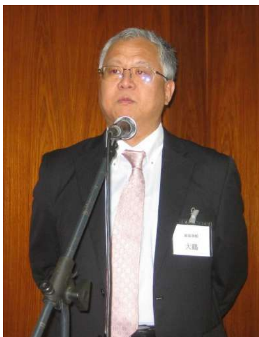
着任挨拶される大鶴総領事