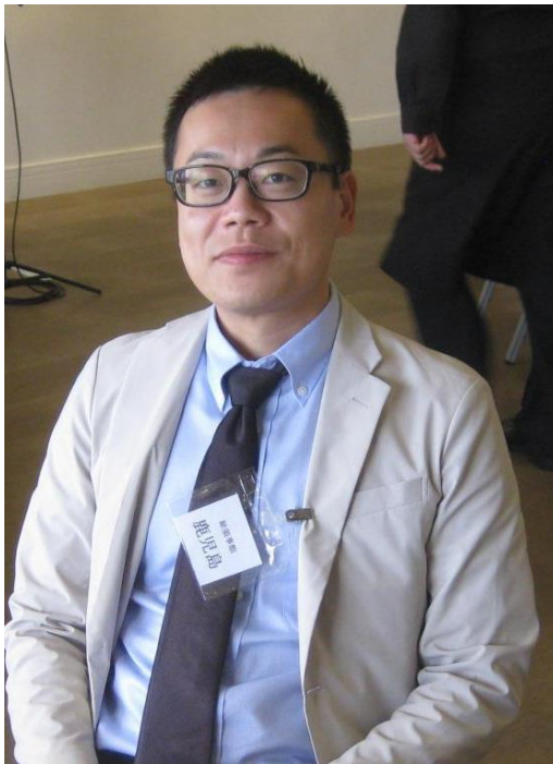
文化関連行事説明された鹿児島領事