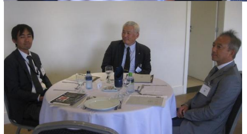
昼食会会場からの絶景を見ながら説明を傾聴し懇談する参加者