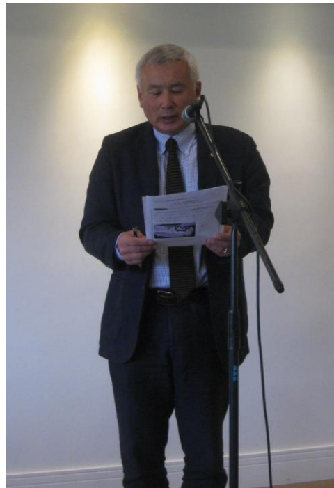
日本人学校活動を説明する引地校長