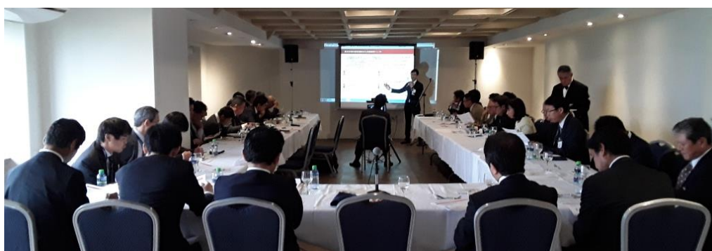
講演を熱心に聞き入る参加者