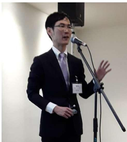
自己紹介される石丸講師