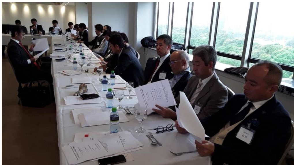
定期総会・臨時総会にて報告書類を審議する正会員の皆様