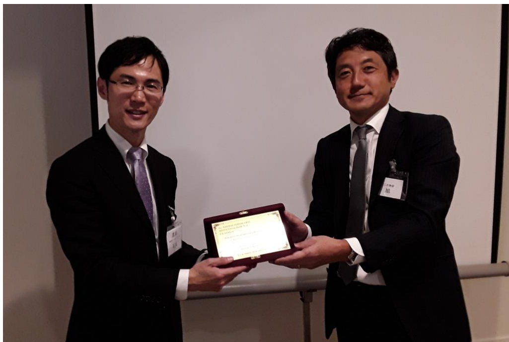
旭会頭から講話記念プレートの贈呈