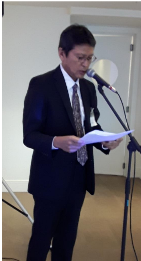
定期総会進行司会する都甲専務理事